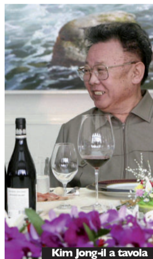
Kim Jong-il a tavola