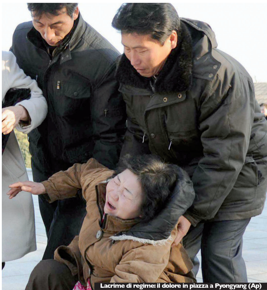
Lacrime di regime: il dolore in piazza a Pyongyang